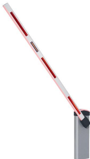
Bild 3: Die automatische Schranke SH 50 sperrt Durchfahrten von bis zu 4710 mm ab und ist für 500 Zyklen pro Tag ausgelegt. Sie ist besonders für Parkplätze von kleineren und mittleren Firmen geeignet.

Bild 2: Die Schranken SH 50 und SH 100 von Hörmann verfügen serienmäßig über eine Kraftbegrenzung. Das Schließen der Schranke stoppt, sobald der Schrankenbaum auf ein Hindernis trifft.