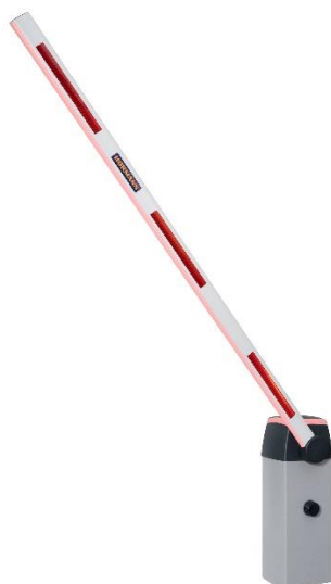
Bild 4: Für Sperrbreiten bis zu 5750 mm und 1.000 Zyklen am Tag ist die automatische Schranke SH 100 von Hörmann entwickelt worden. Sie kommt vor allem auf Parkplätzen von größeren Firmen oder von Wohnanlagen und Mehrfamilienhäusern zum Einsatz.

Download Texte und Bilder: www.hoermann.de/presse