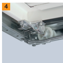
Absetzmulde für Laufrolle