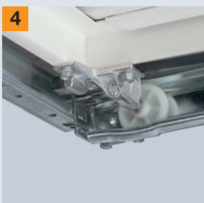
Absetzmulde für Laufrolle

Möchten Sie mehr Sicherheit? Dann wenden Sie sich an Ihren Hörmann Fachhändler!