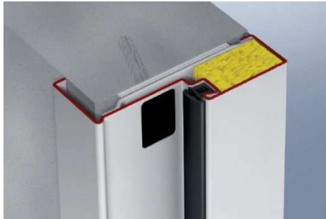
Bild 4: Mit der Hörmann DryFix Zarge können T30 und ganz neu auch T90 Feuerschutztüren mörtelfrei und bis zu fünfzig Prozent schneller eingebaut werden. Die werksseitig mit Mineralwolle hinterfüllte Zarge verhindert zudem nahezu vollständig das Verschmutzungs- und Beschädigungsrisiko der Oberfläche bei der Montage.

Hörmann KG Verkaufsgesellschaft Tore · Türen · Zargen · Antriebe