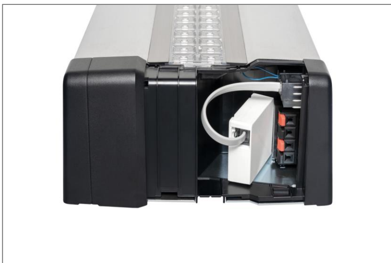
Bild 3: Über die HCP-Bus-Schnittstelle finden die neuen Hörmann Garagentor-Antriebe Anschluss an bestehende

Mit der neu entwickelten HCP-Bus-Schnittstelle, die serienmäßig in alle Modelle der vierten Antriebsgeneration eingebaut ist, öffnet Hörmann die Tür zur Smart-Home Welt. Über den HCP-Bus findet der Garagentor-Antrieb mithilfe eines Funk-Moduls beziehungsweise mittels Systemleitung Anschluss an Hausautomatisierungssysteme wie Homematic und Delta Dore. Als Komponente einer vernetzten Haustechnik lässt sich der Torantrieb bequem über die Benutzeroberfläche des Smart-Home-Systems steuern und beliebig mit weiteren smarten Teilnehmern vernetzen. So könnte beispielsweise das smarte System so programmiert werden, dass sich mit dem Schließen des Garagentores bei Dunkelheit gleichzeitig die Außen- und Flurbeleuchtung einschaltet oder sich das Tor automatisch öffnet, wenn man sich dem Zuhause nähert. Erlaubt das jeweilige Smart-Home-System einen Fernzugriff über das Internet, kann das Garagentor bequem auch von unterwegs aus geöffnet werden, z.B. damit der Briefträger ein Paket dort deponieren kann oder um den Status der eingelernten Geräte überprüfen zu können.