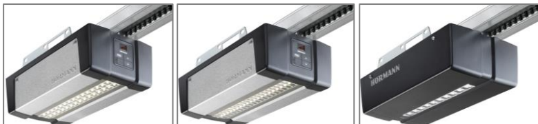
Bild 2: Die drei neuen Antriebe SupraMatic P4, SupraMatic E4 und ProMatic 4 (v.l.n.r.) verfügen über eine energiesparende LED-Beleuchtung, die die Garage beim Ein- und Ausfahren ausleuchtet.