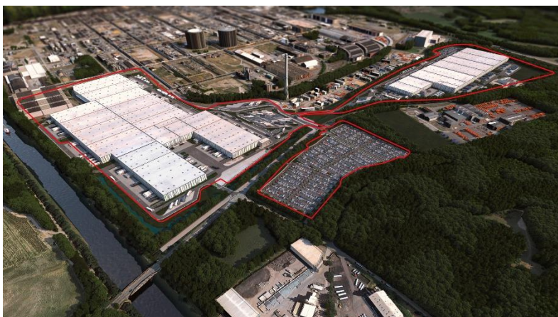
Bild 2: Der Metro Logistikpark in Marl besteht aus zwei Gebäudeteilen mit einer Fläche von 83.000 und 152.000 Quadratmetern und konnte im Februar 2018 fertiggestellt werden.