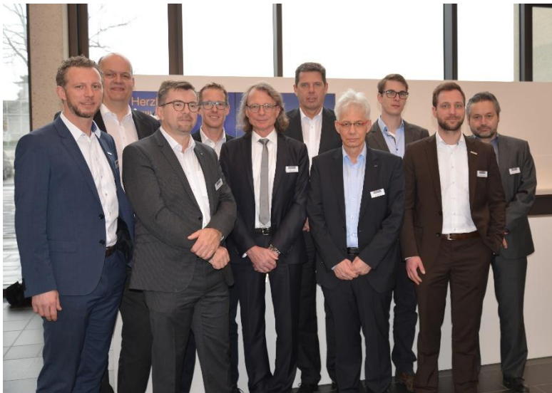
Bild 1: Die Herstellerinitiative „Bauprodukte Digital“ wurde von Unternehmensvertretern der bisherigen Mitglieder dormakaba, Hilti, Hörmann, Jansen Building Systems, Knauf, Schüco, Xella und Forbo Flooring im Rahmen einer Informationsveranstaltung vorgestellt.