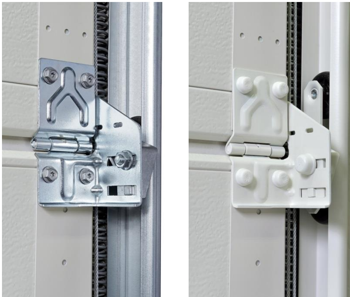
Bild 4: Bild links: Verzinkte Standardausführung. Bild rechts: Für eine harmonische Torinnenansicht ist das LPU 67 Thermo optional in einer Premium-Ausführung erhältlich, d.h. die Scharniere, Laufschiene und Zarge sind grauweiß, also in der gleichen Farbe wie die Innenseite des Tores. Tandem-Laufrollen sorgen für eine nochmals verbesserte Laufruhe.

Bild 3: Die 67 Millimeter starken Lamellen des LPU 67 Thermo Tores sind thermisch voneinander getrennt und ermöglichen so eine besonders hohe Wärmedämmung (Bild links). Eine doppelte Bodendichtung sorgt zusätzlich dafür, dass der Energieverlust reduziert wird (Bild rechts).