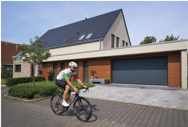
Bild 2: Für immer besser gedämmte Häuser und Garagen hat Hörmann nun ein besonders wärmegeämmtes Sectionaltor im Programm.