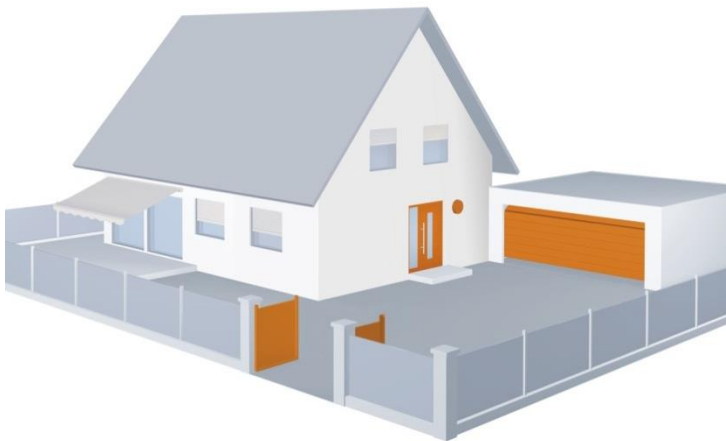
Bild 5: Mit der BiSecur App lassen sich Hörmann Einfahrts- und Garagentorantriebe, die Beleuchtung sowie die neuen Hörmann Aluminium-Haustüren ThermoSafe und ThermoCarbon von jedem Ort der Welt aus steuern und kontrollieren.