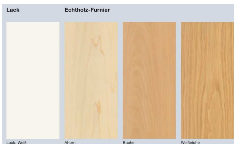
Bild 11: Die neuen Hrmann Innentren werden je nach Ausfhrung auch mit einer Wei-Lack-Oberflche oder mit Schutzlack versiegelten Echtholz furnieren angeboten.

Download Texte und Bilder: www.hoermann.de/presse