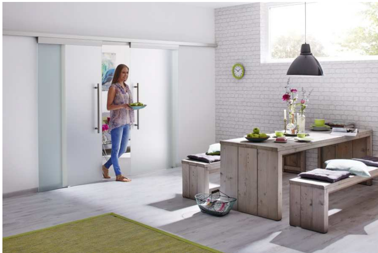
Bild 3: Platzsparend und transparent: Die Glasschiebetüren des neuen Hörmann Innentürenprogramms sorgen für lichtdurchflutete Räume und eine optimale Flächennutzung vor und hinter der Tür.

Bild 2: Die neuen Hörmann Innentüren sind je nach Ausführung ein- und auch zweiflügelig für großzügige Raumdurchgänge erhältlich.