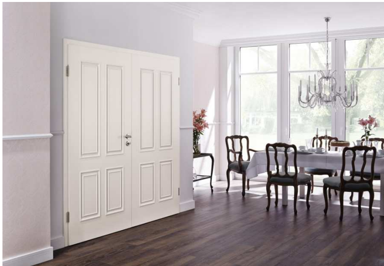
Bild 7: Die DesignLine des neuen Hörmann Innentürenprogramms hält für jeden Geschmack ein passendes Türendesign parat. So kann aus neun verschiedenen Motiven im Landhausstil gewählt werden.

Bild 6: Die DesignLine des neuen Hörmann Innentürenprogramms gewährt exklusive Gestaltungsmöglichkeiten. So bietet sie beispielsweise Türen mit einer Edelstahl-Applikation.