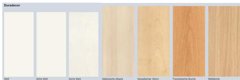
Bild 10: Die neue Hrmann Innentroberflche Duradecor ist nahezu so robust wie eine Kchenarbeitsplatte. Erhltlich in sieben verschiedenen Designs sorgt sie dafr, dass die neuen Hrmann Innentren dauerhaft schn bleiben.

Hrmann KG Verkaufsgesellschaft Tore · Tren · Zargen · Antriebe