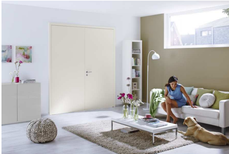
Bild 2: Die neuen Hörmann Innentüren sind je nach Ausführung ein- und auch zweiflügelig für großzügige Raumdurchgänge erhältlich.