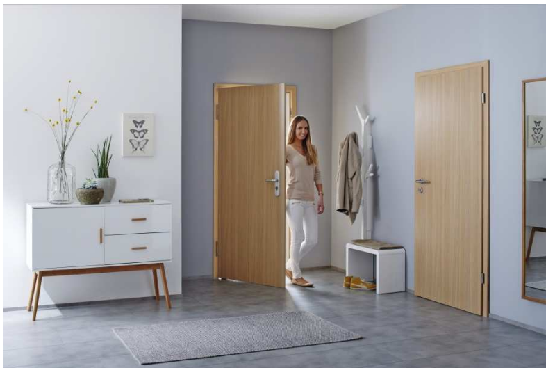
Bild 5: Ebenfalls Bestandteil des neuen Hörmann Programms werden Wohnungsabschlusstüren sein. Die Türen der TechnikLine halten Temperaturunterschieden zwischen dem Wohnungsinneren und dem Hausflur ohne Verziehen stand und lassen den Lärm des Hausflures draußen. Optisch harmonisieren sie mit den anderen Innentüren des Programms.

Bild 4: Die DesignLine des neuen Hörmann Innentürenprogramms bietet neben Türen im Landhausstil, mit einer Edelstahl-Applikation oder Fugen auch Motive mit Glasausschnitten für mehr Transparenz und Licht im Raum.