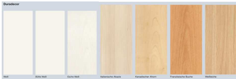
Bild 10: Die neue Hörmann Innentüroberfläche Duradecor ist nahezu so robust wie eine Küchenarbeitsplatte. Erhältlich in sieben verschiedenen Designs sorgt sie dafür, dass die neuen Hörmann Innentüren dauerhaft schön bleiben.

Hörmann KG Verkaufsgesellschaft Tore · Türen · Zargen · Antriebe