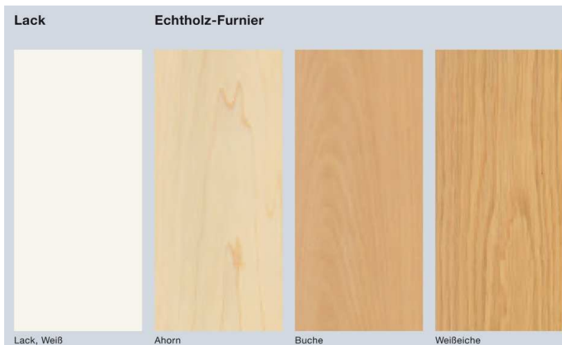
Bild 11: Die neuen Hörmann Innentüren werden je nach Ausführung auch mit einer Weiß-Lack-Oberfläche oder mit Schutzlack versiegelten Echtholz furnieren angeboten.

Download Texte und Bilder: www.hoermann.de/presse