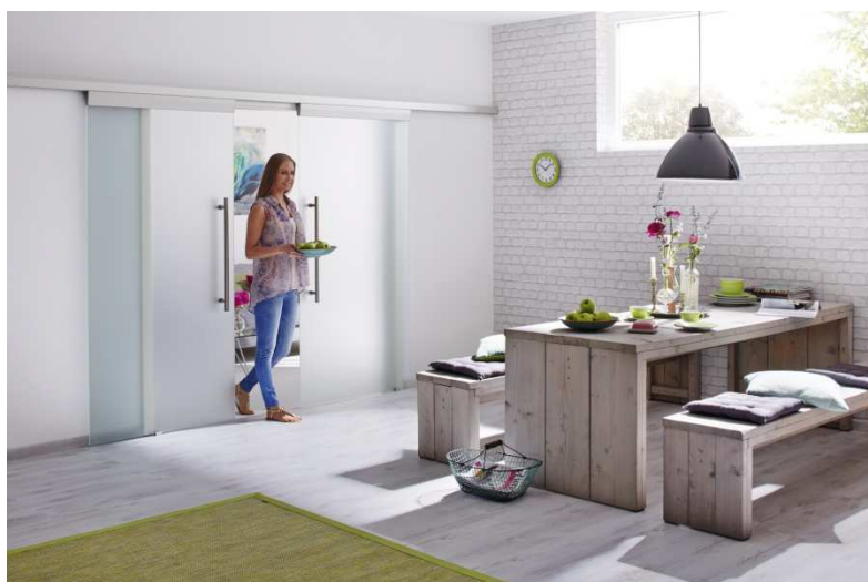
Bild 3: Platzsparend und transparent: Die Glasschiebetüren des neuen Hörmann Innentürenprogramms sorgen für lichtdurchflutete Räume und eine optimale Flächennutzung vor und hinter der Tür.

Bild 2: Die neuen Hörmann Innentüren sind je nach Ausführung ein- und auch zweiflügelig für großzügige Raumdurchgänge erhältlich.