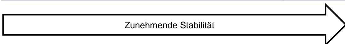
Bild 12: Hörmann bietet für die verschiedenen Anforderungen an Beanspruchung unterschiedliche Torblatteinlagen an. Türen mit Lichtausschnitt werden unabhängig von den Anforderungen an Beanspruchung immer mit Vollspanplatte geliefert.