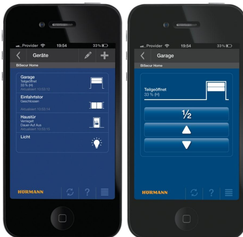
Bild 3: In der Hörmann APP wird über Symbole die Position der eingerichteten Tore und Türen sowie der Beleuchtung dargestellt.