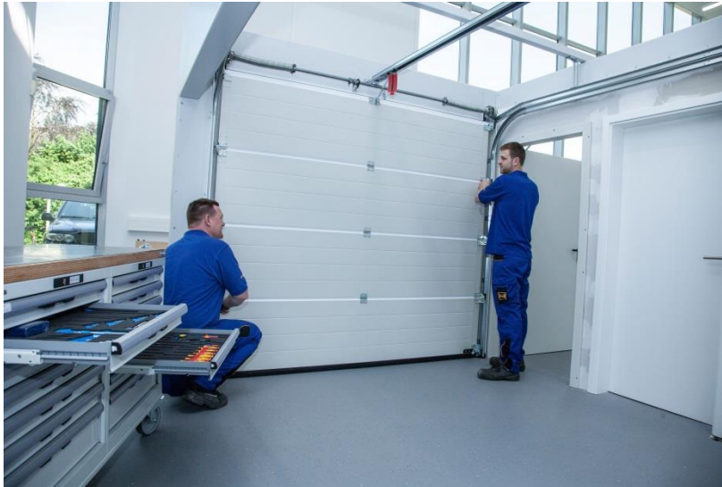
Bild 4: Mobile Werkbänke und Werkzeuge ermöglichen eine uneingeschränkte Tor- und Türmontage. So kann in mehreren Gruppen parallel gearbeitet werden.