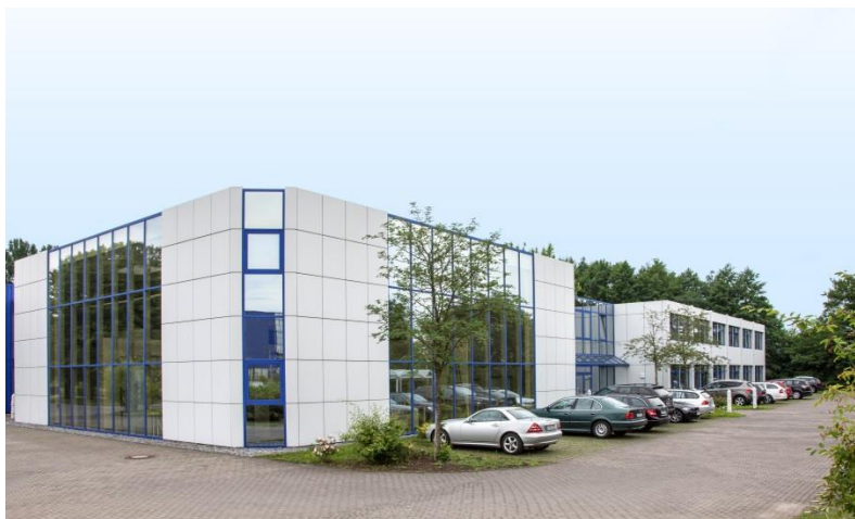
Bild 1: Im Juni hat Hörmann sein neues Montagezentrum in Steinhagen eröffnet. In praxisorientierten Trainings lernen Mitarbeiter und Händler hier die Montage der gesamten Produktpalette von Hörmann.