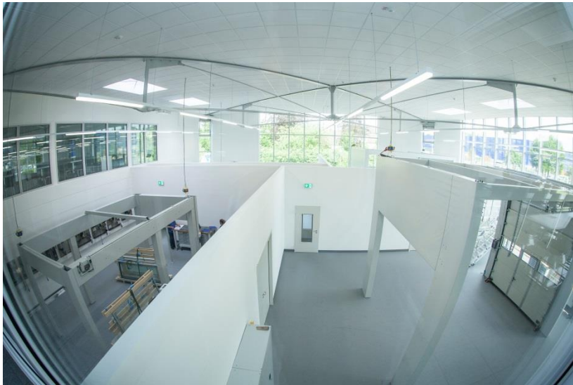
Bild 2: Das Montagezentrum ist im Innenraum in vier Montagebereiche unterteilt. Im Obergeschoss befinden sich vier großzügige Schulungsräume.