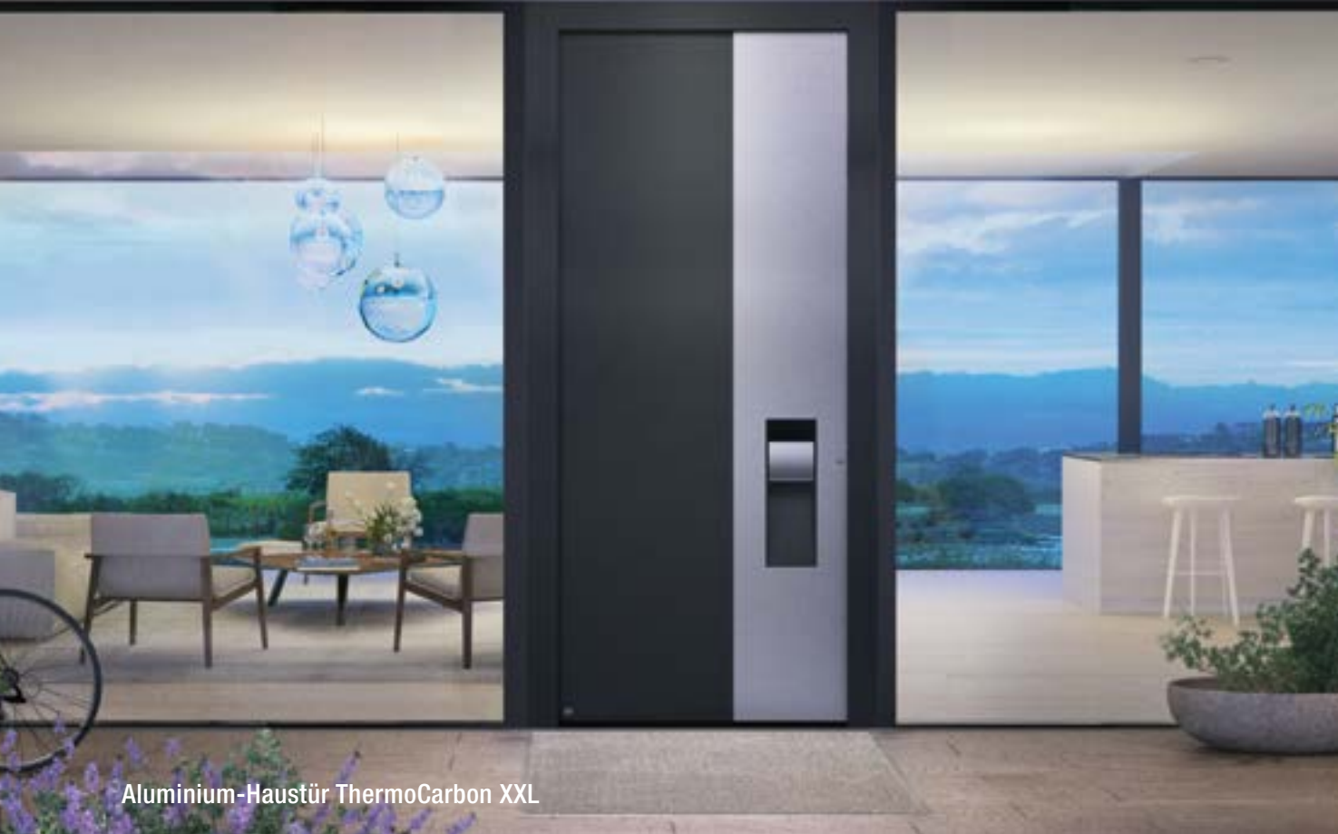
Aluminium-Haustür ThermoCarbon XXL

NEU: XXL-Ausführung bis 3 m Türhöhe (ThermoCarbon)