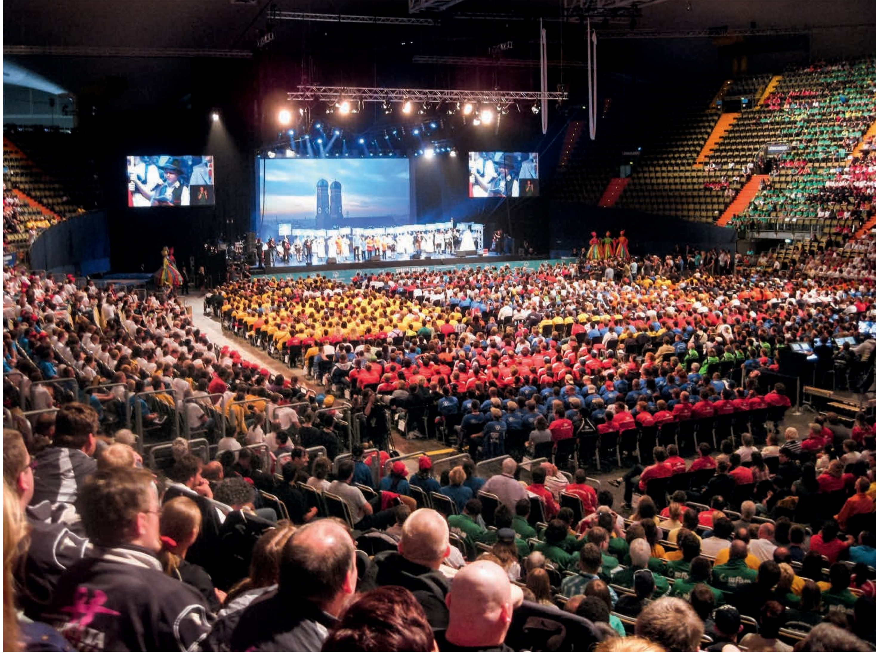
Nationale Spiele von Special Olympics Deutschland in München vom 20. bis 25. Mai 2012.