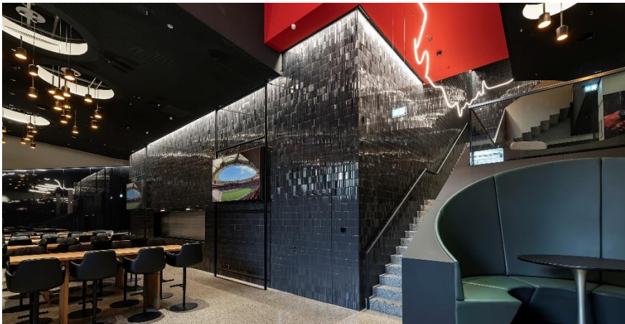
Bild 5: Türelemente mit spezialveredelten Oberflächen aus keramischen Fliesen bilden markante Zugänge.