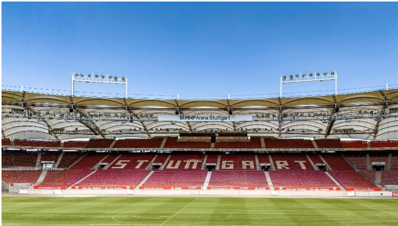
Bild 1: Die MHP Arena in Stuttgart wurde 2023/2024 umfassend renoviert. Der Hersteller Neuformtür lieferte die passenden Türen.