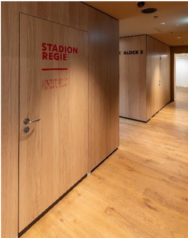
Bild 2: Vollholz-Türelemente von Neuformtür, teilweise in Schallschutzklasse 3, sorgen für eine wirksame akustische Abschirmung in stark frequentierten Bereichen.