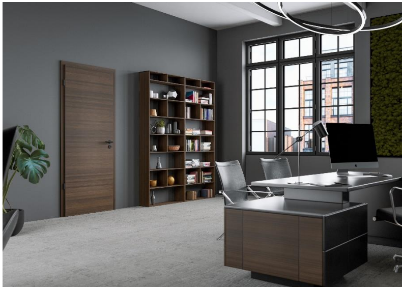
Bild 1: Feine Linien, große Wirkung – die Listello als stilistisches Detail.