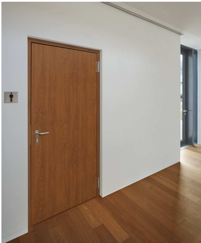
Bild 5: Die nach der Produktnorm EN 16034 zugelassenen Hörmann Feuerschutztüren werden bei Markteinführung auch in drei detailgetreuen Dekoren in Holzoptik erhältlich sein.

Bild 4: Mit der Hörmann DryFix Zarge können T30 und ganz neu auch T90 Feuerschutztüren mörtelfrei und bis zu fünfzig Prozent schneller eingebaut werden. Die werksseitig mit Mineralwolle hinterfüllte Zarge verhindert zudem nahezu vollständig das Beschmutzungs- und Beschädigungsrisiko der Oberfläche bei der Montage.