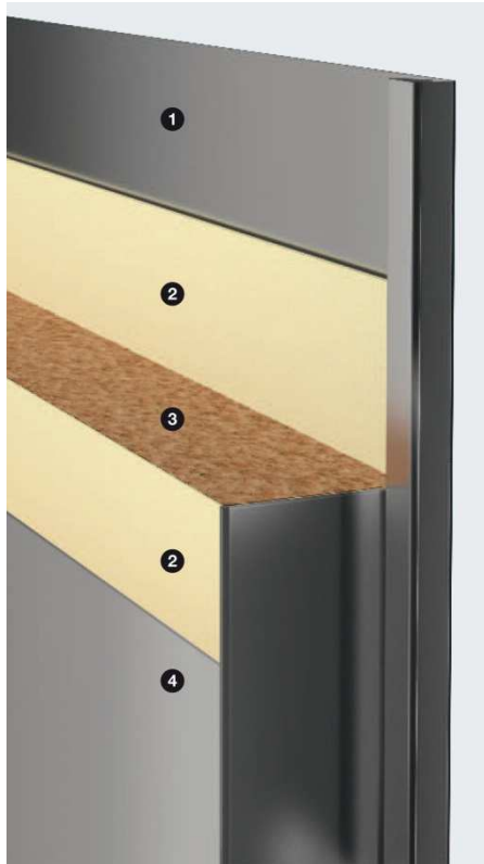
Bild 2: Die vollflächig verklebte Verbundkonstruktion der Hörmann Feuerschutztür OD sorgt für ein dauerhaft plan-ebenes und stabiles Türblatt: 1. Stahlblech, 2. Beidseitig vollflächige Verklebung, 3. Brandschutzeinlage, 4. Planebene Oberfläche.