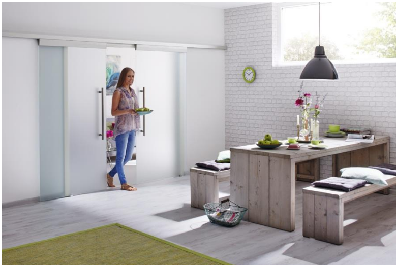
Bild 3: Platzsparend und transparent: Die Glasschiebetüren des neuen Hörmann Innentürenprogramms sorgen für lichtdurchflutete Räume und eine optimale Flächennutzung vor und hinter der Tür.

Bild 2: Die neuen Hörmann Innentüren sind je nach Ausführung ein- und auch zweiflügelig für großzügige Raumdurchgänge erhältlich.