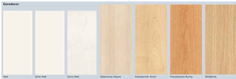
Bild 10: Die neue Hrmann Innentroberflche Duradecor ist nahezu so robust wie eine Kchenarbeitsplatte. Erhltlich in sieben verschiedenen Designs sorgt sie dafr, dass die neuen Hrmann Innentren dauerhaft schn bleiben.

Hrmann KG Verkaufsgesellschaft Tore · Tren · Zargen · Antriebe