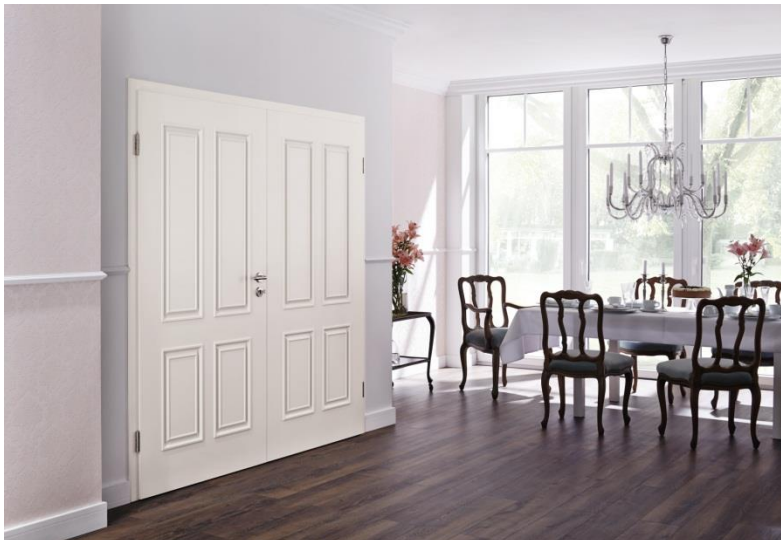
Bild 7: Die DesignLine des neuen Hörmann Innentürenprogramms hält für jeden Geschmack ein passendes Türendesign parat. So kann aus neun verschiedenen Motiven im Landhausstil gewählt werden.

Bild 6: Die DesignLine des neuen Hörmann Innentürenprogramms gewährt exklusive Gestaltungsmöglichkeiten. So bietet sie beispielsweise Türen mit einer Edelstahl-Applikation.