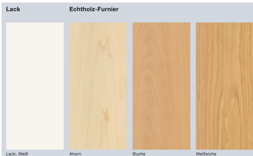
Bild 11: Die neuen Hrmann Innentren werden je nach Ausfhrung auch mit einer Wei-Lack-Oberflche oder mit Schutzlack versiegelten Echtholz furnieren angeboten.

Download Texte und Bilder: www.hoermann.de/presse