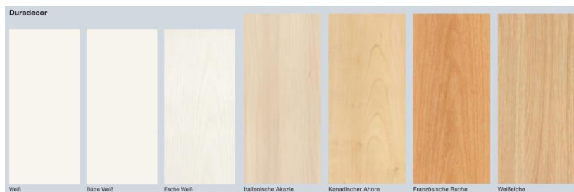
Bild 10: Die neue Hörmann Innentüroberfläche Duradecor ist nahezu so robust wie eine Küchenarbeitsplatte. Erhältlich in sieben verschiedenen Designs sorgt sie dafür, dass die neuen Hörmann Innentüren dauerhaft schön bleiben.

Hörmann KG Verkaufsgesellschaft Tore · Türen · Zargen · Antriebe