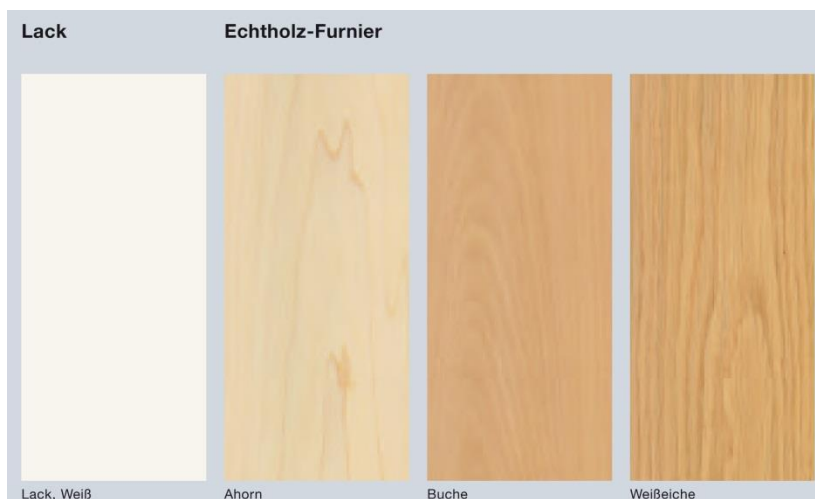
Bild 11: Die neuen Hörmann Innentüren werden je nach Ausführung auch mit einer Weiß-Lack-Oberfläche oder mit Schutzlack versiegelten Echtholz furnieren angeboten.

Download Texte und Bilder: www.hoermann.de/presse