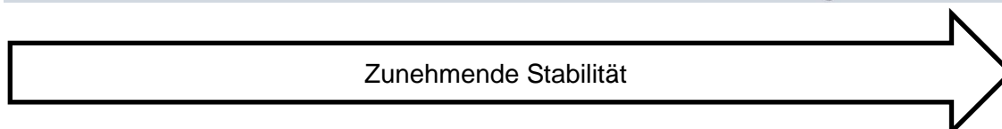
Bild 12: Hörmann bietet für die verschiedenen Anforderungen an Beanspruchung unterschiedliche Torblatteinlagen an. Türen mit Lichtausschnitt werden unabhängig von den Anforderungen an Beanspruchung immer mit Vollspanplatte geliefert.