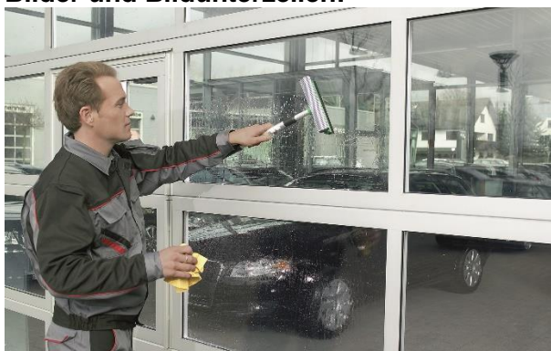
Bild 2: Für mehr Tageslicht in der Halle werden die neuen besonders wärmegeprägten Industrietore optional mit Verglasung angeboten. Die besonders kratzfeste Duratec Kunststoff-Verglasung bewahrt trotz starker Beanspruchung in der Industrieumgebung dauerhaft ihre Transparenz.