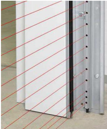
Bild 6: Das bei Hörmann Schnellauftoren bereits serienmäßig integrierte Lichtgitter kann nun auch bei Industrie-Sectionaltoren eingesetzt werden. Es ermöglicht durch die großflächige Erfassung der Lichtstrahlen schnellere Laufgeschwindigkeiten des Tores. Schnellere Laufgeschwindigkeiten wiederum verhindern hohe Energieverluste beim Öffnen und Schließen des Tores und sorgen für einen sicheren und reibungslosen Arbeitsablauf.

Bild 5: Ein zusätzliches Kunststoffprofil, der Hörmann ThermoFrame, sorgt für eine Trennung von Mauerwerk und Zarge und verringert so die dort entstehende Kältebrücke. Die Wärmedämmung kann bis zu einundzwanzig Prozent verbessert werden.