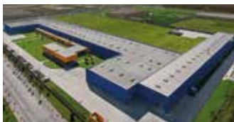
Hörmann Tianjin, China