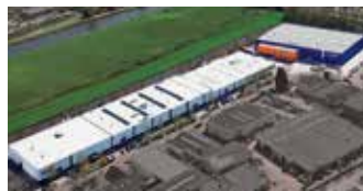
Hörmann Alkmaar B.V., Niederlande