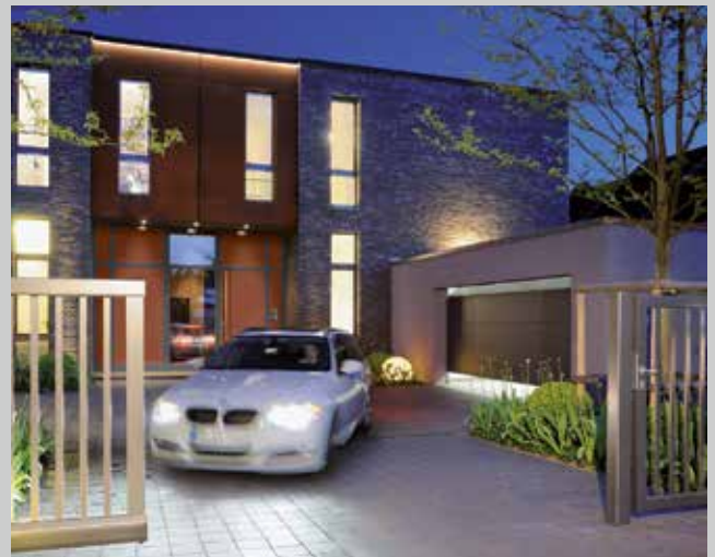
Garagentore und Torantriebe

Wählen Sie aus dem umfassenden Programm für Neubau, Ausbau und Modernisierung.