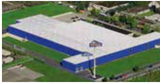
Hörmann KG Dissen, Deutschland