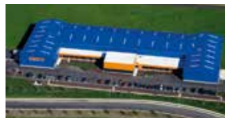
Hörmann Flexon LLC, Burgettstown PA, USA