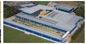
Hörmann KG Brockhagen, Deutschland