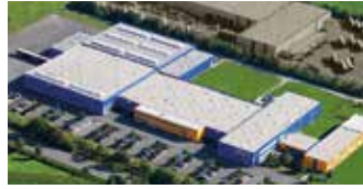
Hörmann KG Antriebstechnik, Deutschland