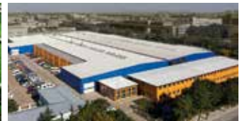
Hörmann Beijing, China