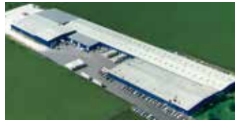
Hörmann LLC, Montgomery IL, USA