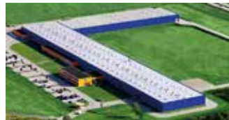
Hörmann Legnica Sp. z o.o., Polen