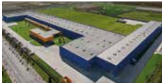
Hörmann Tianjin, China