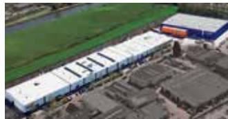
Hörmann Alkmaar B.V., Niederlande