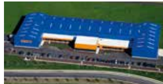
Hörmann Flexon LLC, Burgettstown PA, USA