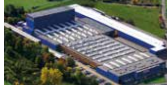
Hörmann KG Freisen, Deutschland