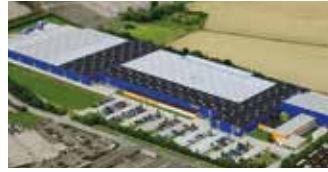
Hörmann KG Brandis, Deutschland