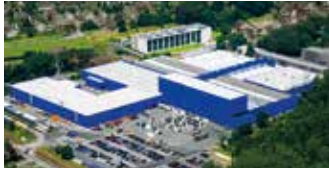
Hörmann KG Amshausen, Deutschland