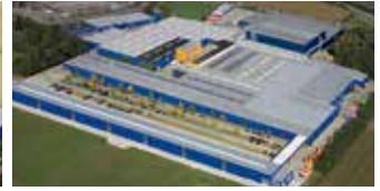
Hörmann KG Brockhagen, Deutschland