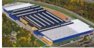
Hörmann KG Eckelhausen, Deutschland