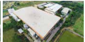
Shakti Hörmann Pvt. Ltd., Indien

Als einziger Hersteller auf dem internationalen Markt bietet die Hörmann Gruppe alle wichtigen Bauelemente aus einer Hand. Sie werden in hochspezialisierten Werken nach dem neuesten Stand der Technik gefertigt. Durch das flächendeckende Vertriebs- und Servicenetz in Europa und die Präsenz in Amerika und Asien ist Hörmann Ihr starker, internationaler Partner für hochwertige Bauelemente. In einer Qualität ohne Kompromisse.