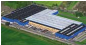
Hörmann KG Werne, Deutschland