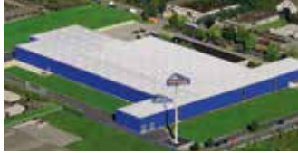
Hörmann KG Dissen, Deutschland