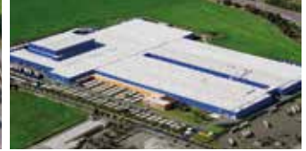
Hörmann KG Ichtershausen, Deutschland